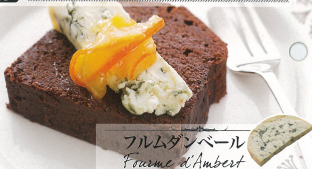
フルムダンベール Furm d'Ambert